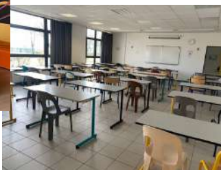
Salle de permanence