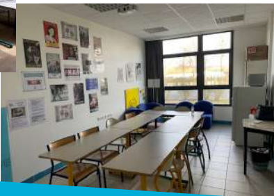
Salle des ambassadeurs et espace écoute