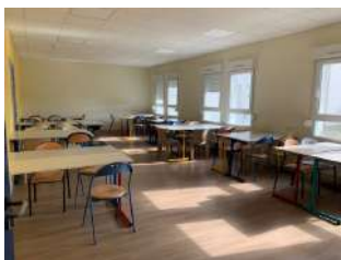
Salle de travail en autonomie